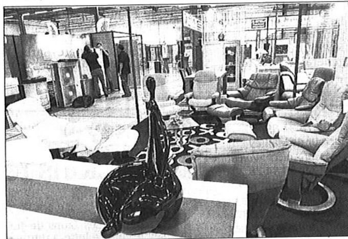
■ Le parc a déjà accueilli 22.000 visiteurs.

Autre thème largement abordé lors de cette assemblée générale : la régionalisa-